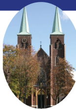
Onbevlekt Ontvangen Amstenrade